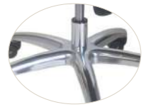
Aluminium base Base de aluminio