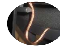
Detail of special wiring conducting Detalle conducción de cableado especial