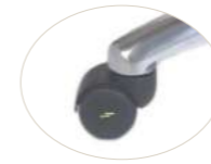
50 mm antistatic wheel Rueda 50 mm antiestática